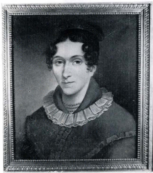
Pastel, 48,5 x 41,5 cm.