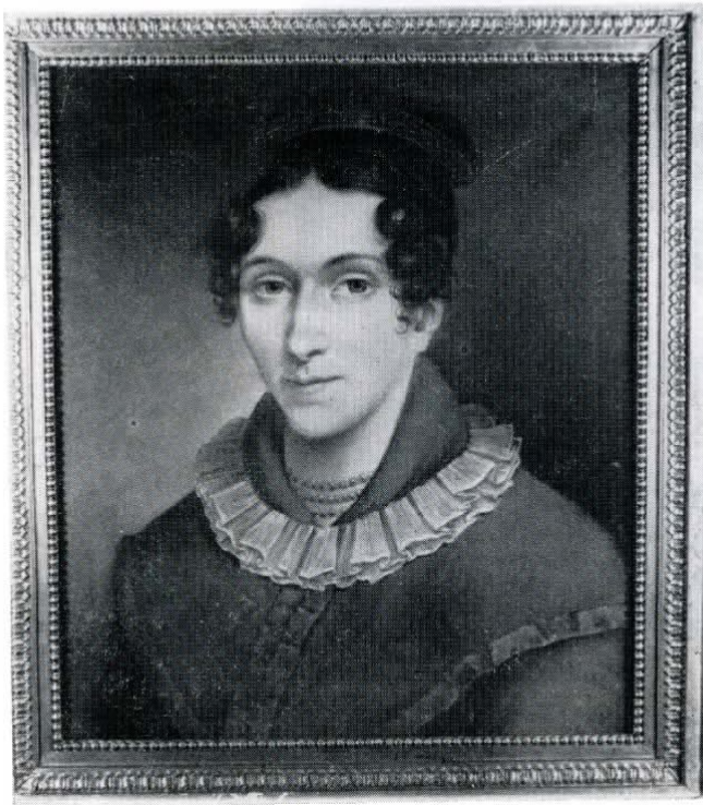
Pastel, 48,5 x 41,5 cm.