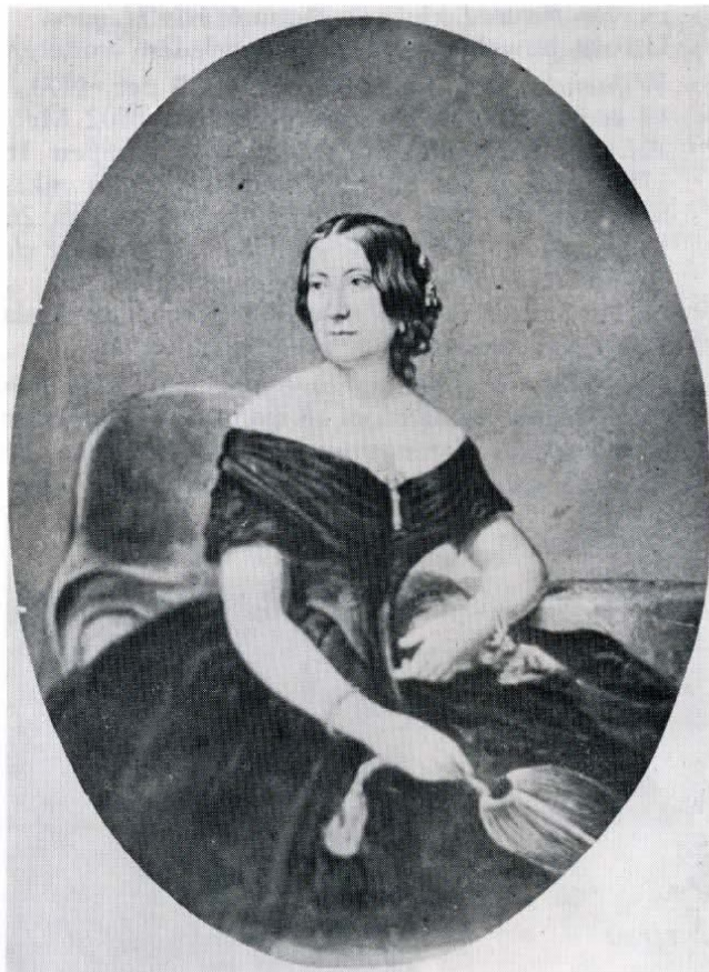
N. Pieneman, 1849.