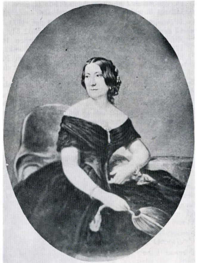
N. Pieneman, 1849.